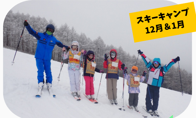
スキーキャンプ 12月&1月

事前にカウンセラーのスキー研修があります。 レンタルスキーもあるので安心してキャンプに 参加できる！ ウェアがあれば大丈夫