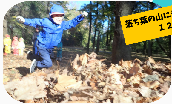
落ち葉の山にジャンプ！ 12月